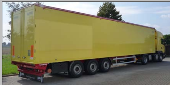
Carnehl Schubboden in Vollaluminium