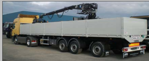
Baustoffsattel mit Rollkran