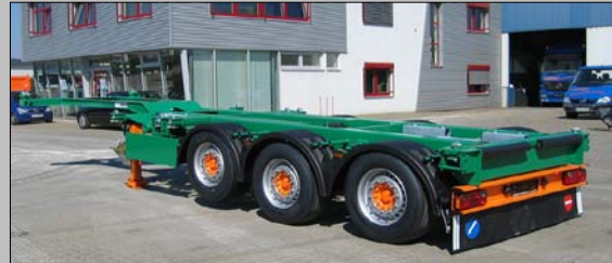
Containerchassis mit Doppelteleskop

weitere Beispiele aus unserem vielfältigen Produktsortiment: