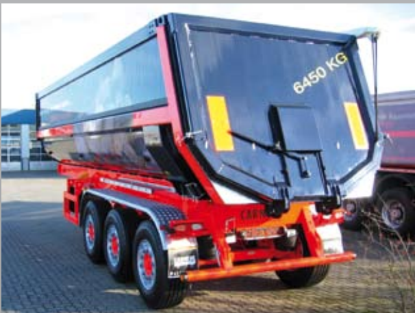
Alu-Rückwand mit Getreideschieber