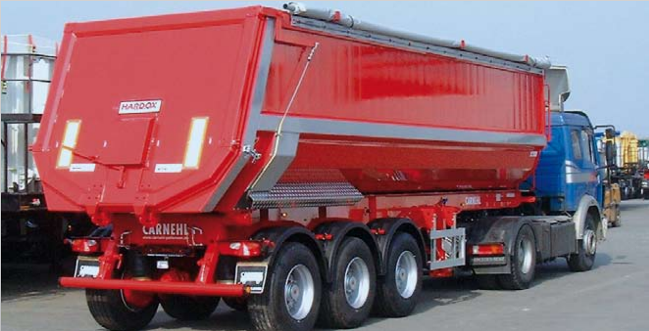
Halbschalenmulde aus Aluminium u. Hardox-Stahl