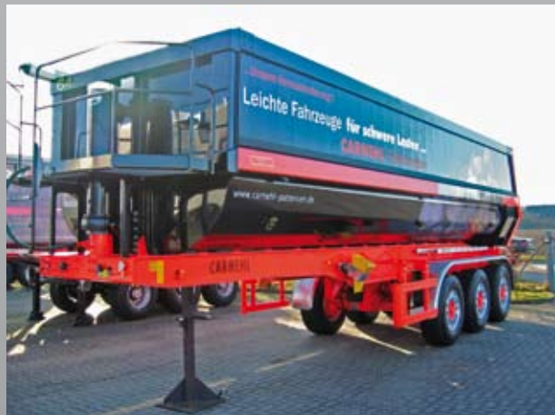
Sicherheitspodest zur Planenbetätigung