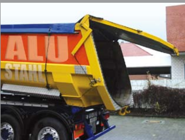
Rückwand mit pneumatischer Öffnung über Seilzug